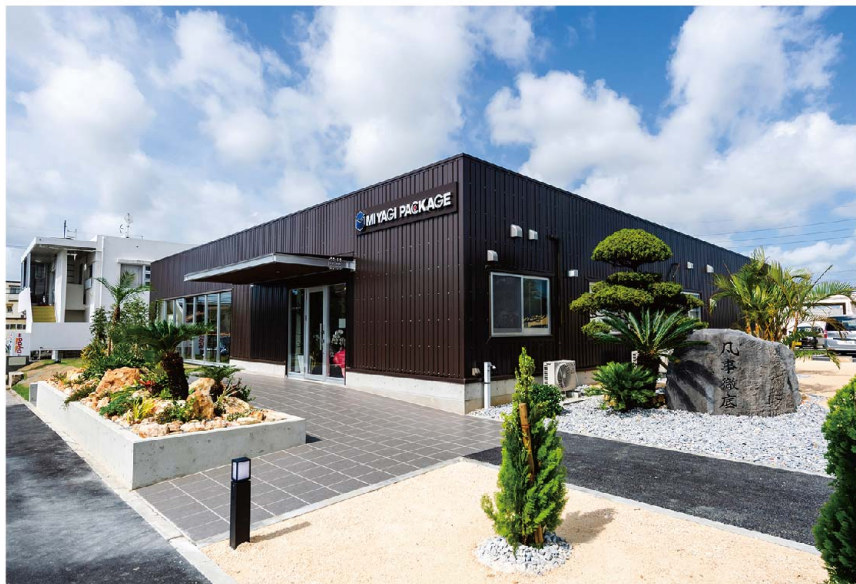
本社 (八重瀬町屋宜原)

商品を包み、消費者の購買意欲を左右するパッケージ。 商品の個性や特長を最大限に引き出すパッケージのご提案ができます。