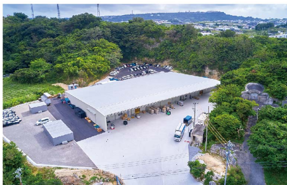
工場 (八重瀬町新城)

県内で、化粧箱の企画設計・デザインから印刷・紙箱製造までを一貫して行っている会社です。 ダンボール素材から薄い紙までなんでも加工でき、化粧箱だけでなく、包装資材全般のご提案が可能となっております。