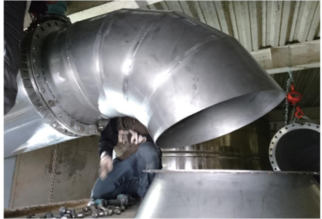
ステンレス加工の様子