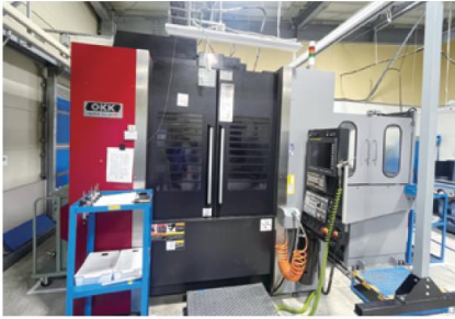
OKKマシニングセンタ

グローバルな視野を持つ金型製造拠点 自動車部品製造用の金型を製造・販売しています。